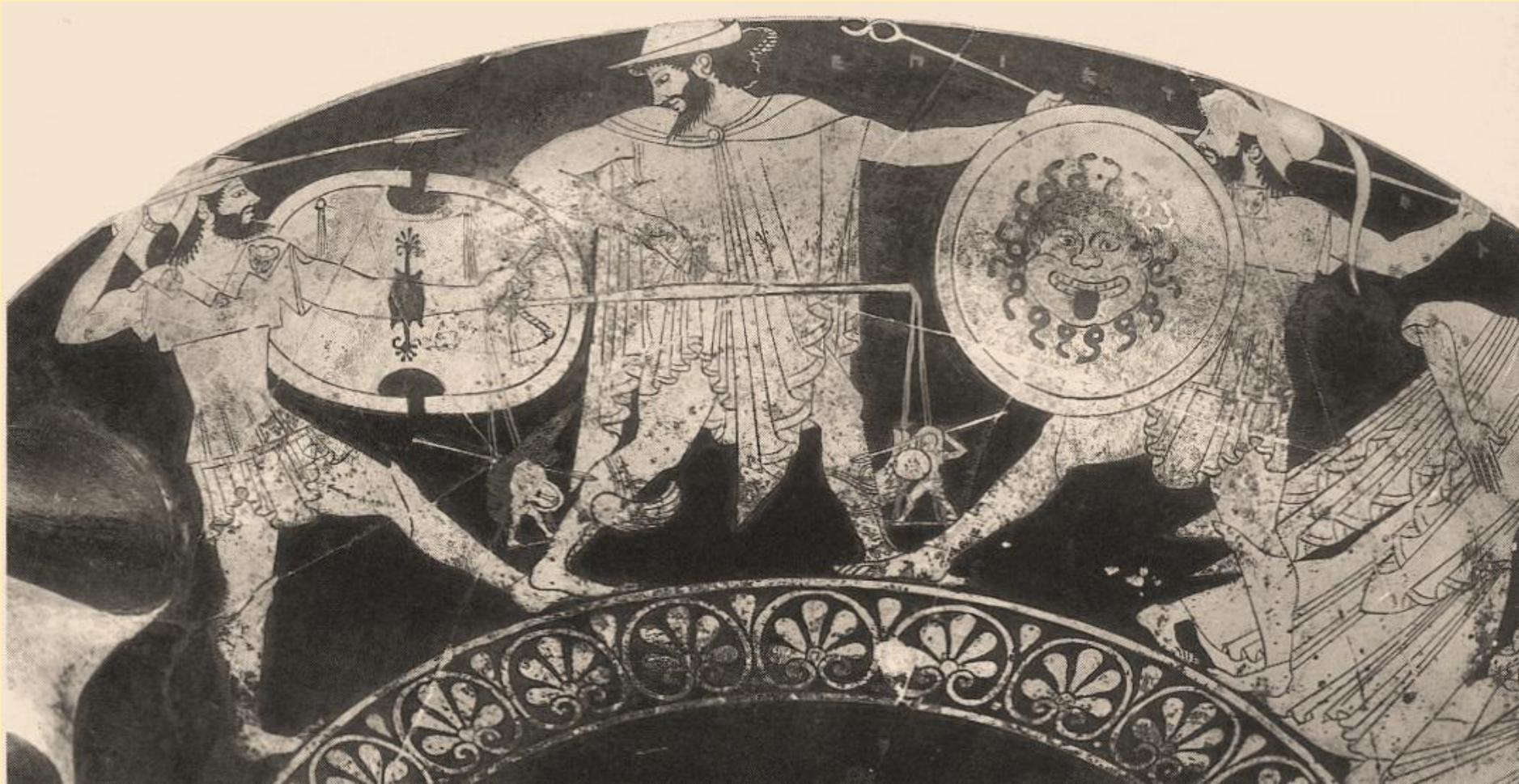
Κύλικα στη Villa Giulia, Ρώμη. Περί το 510 π. Χ.