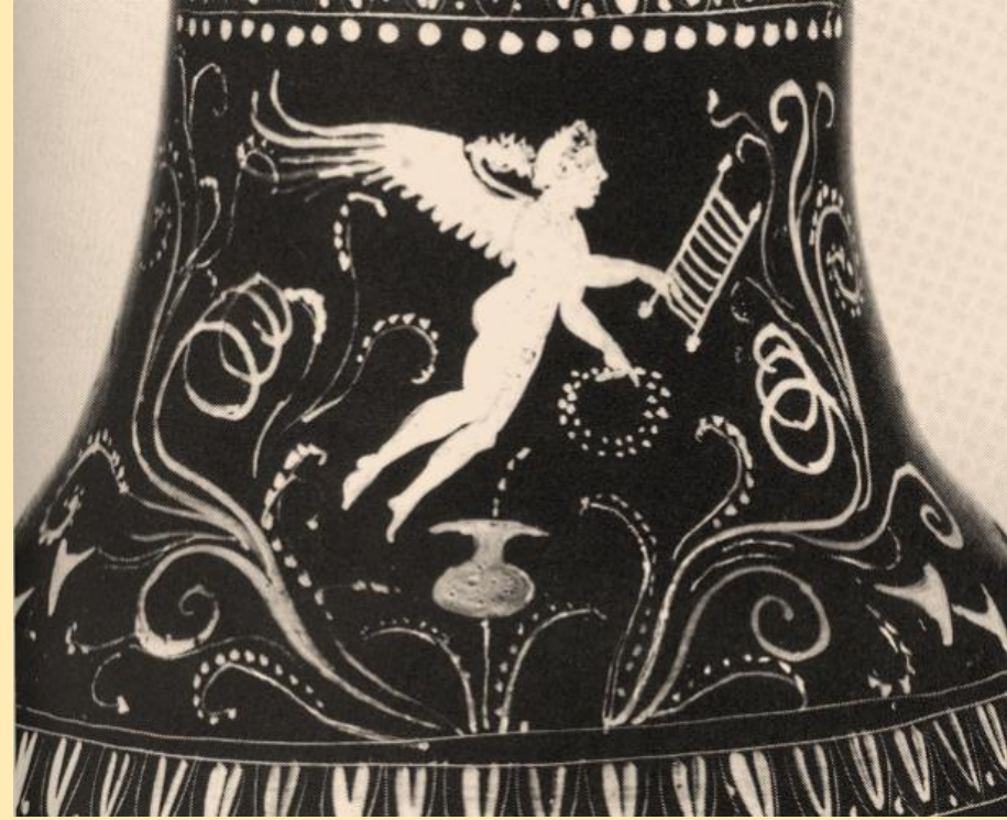
Πελίκη στο Birmingham, πρώιμος 4 ος π. Χ. αι.