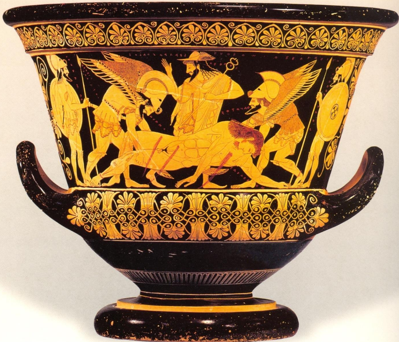
Κρατήρας Ευφρονίου, ΜΕΤ Νέα Υόρκη, 515-510 π. Χ.