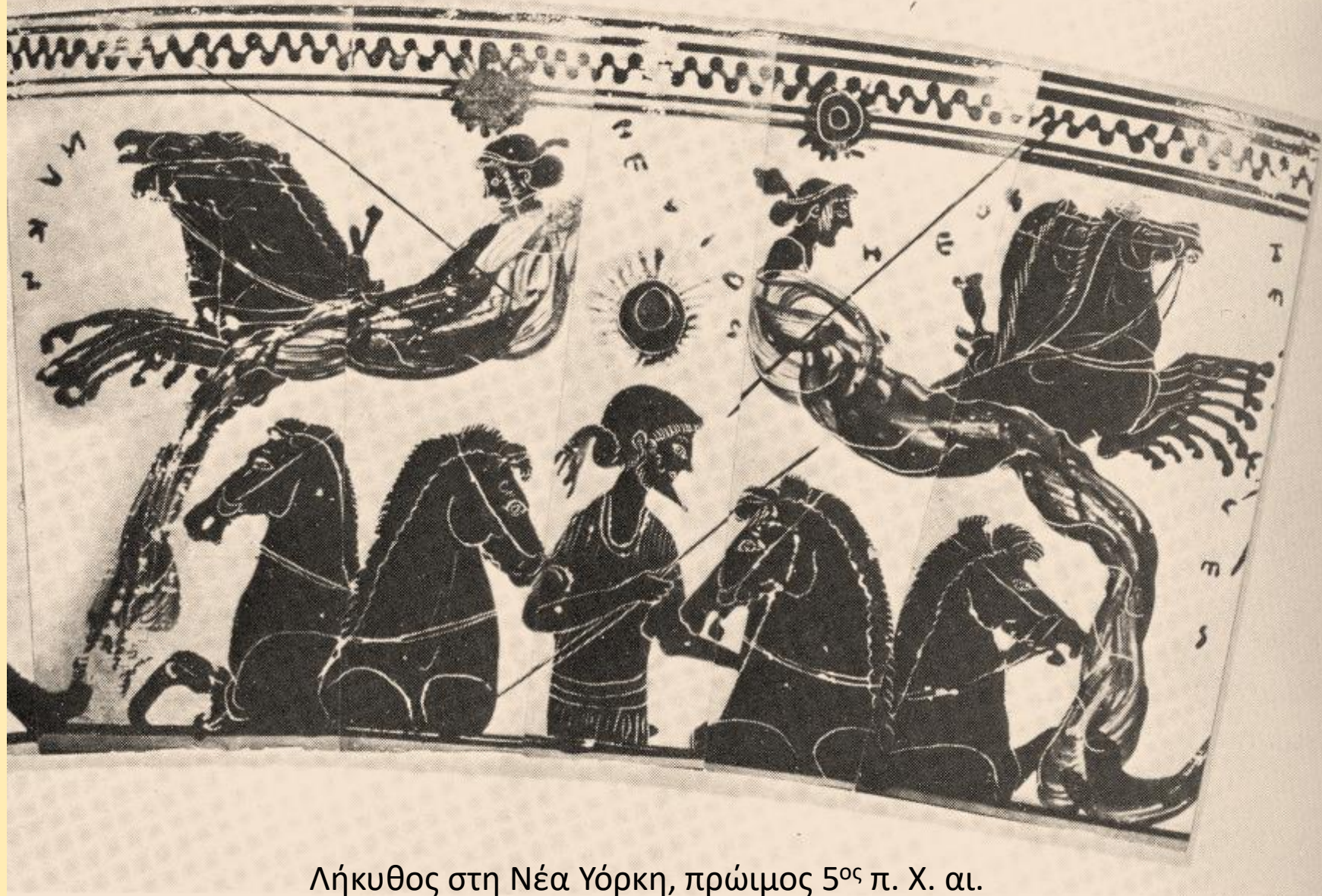
Λήκυθος στη Νέα Υόρκη, πρώιμος 5 ος π. Χ. αι.