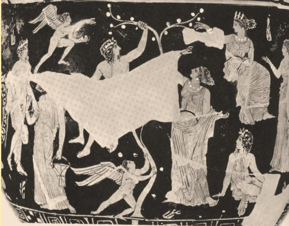
Κρατήρας Βοστώνης, περί το 400 π. Χ.