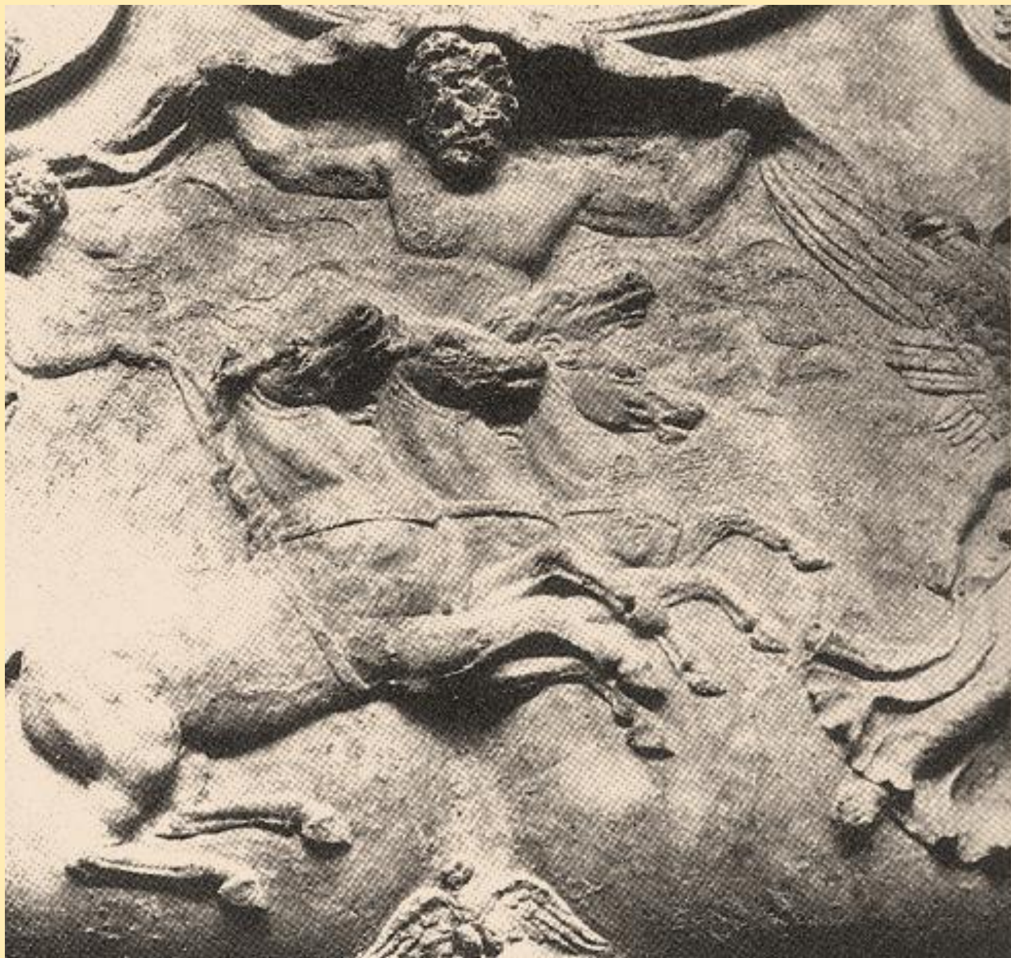
Θώρακας Αυγούστου Prima Porta, Βατικανό, 20-17 π. Χ.