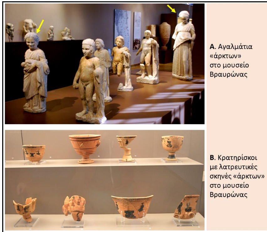
A. Αγαλμάτια «άρκτων» στο μουσείο Βραυρώνας