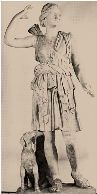
Άγαλμα στο Mariemont Αντίγραφο έργου του 4 ου π.Χ. αι.