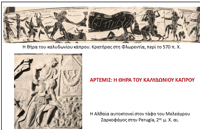
Η θήρα του καλυδωνίου κάπρου. Κρατήρας στη Φλωρεντία, περί το 570 π. Χ.

- Σύμφωνα με άλλη ομάδα μύθων η θεά τιμώρησε τους Αιτωλούς, γιατί ο βασιλιάς τους Οινέας θυσίασε σε όλους τους θεούς ξεχνώντας την Άρτεμη. Γι' αυτό η θεά έστειλε στη χώρα τον Καλυδώνιο κάπρο , ο οποίος την κατέστρεφε. Ο γιος του Οινέα Μελέαγρος οργάνωσε κυνήγι για την εξόντωση του θηρίου (εικ.13), αλλά πέθανε μετά γιατί η μητέρα του Αλθαία, έριξε στη φωτιά ένα κούτσουρο αγνοώντας ότι από αυτό εξαρτιόταν η ζωή του. Η ίδια μετά αυτοκτόνησε.