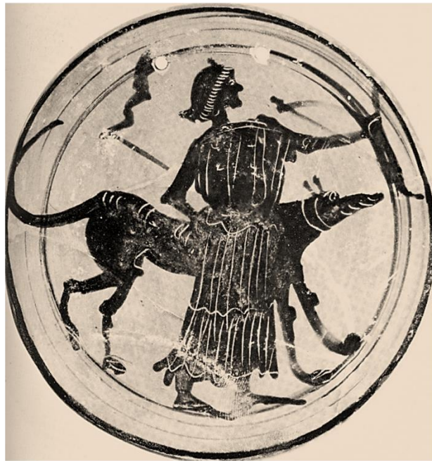
Η Άρτεμις με τους σκύλους της. Πίσω της δάδα Δίσκος στην Τυβίγγη, 5 ος π. Χ. αι.